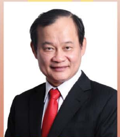
YB拿督倪可漢律師 霹靂州議會議長兼 木威區國會議員