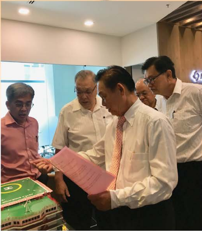
▲ 一艘船可以入住500餘人，大家聽得津津有味。

領南昌造船廠與福建省冠海造船工業有限公司合作，成功打造世界領先的DP2定位系統的SK101海洋工程船，該船具有自控駕駛和在狂風駭浪中自動定位，自動安全靠泊碼頭的功能，在福建造船史上具有里程碑意義。