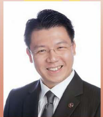
YB倪可敏 國會下議院副議長