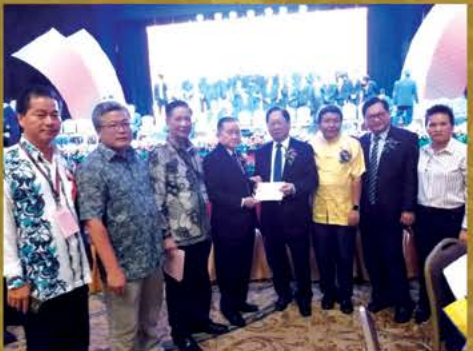
名譽顧問 - 天猛公拿督劉利民