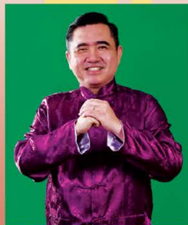
主賓馬來西亞交通部長 YB陸兆福