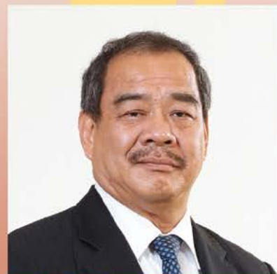
丹斯里拿督斯里江作漢 馬福名譽顧問