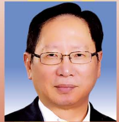
天猛公拿督劉利民 馬福名譽顧問

一元復始，萬象更新。新的一年開啟新的希望，新的歷程承載新的夢想。2019己亥年正是我們創造夢想、揚帆啟航的關鍵之年。祝願大家迎難而上、銳意進取、團結協作、大膽創新、共創輝煌！亦祝大家歡歡喜喜迎新年，幸幸福福慶團圓！