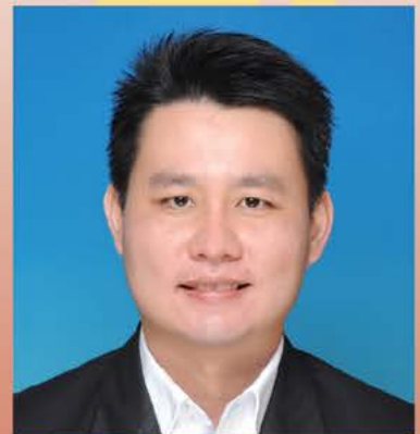
YB林思健律師 馬來西亞國會上議員兼 國家棕油局董事