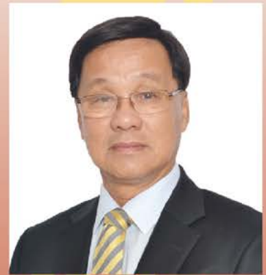
丹斯里方天興 華總總會長

我深信在未來的日子裡，福州人肯定持續致力保留並體現“福州人精神”，在發揚中華文化之餘，也共同促進社會的發展，積極參與大馬各項社會事務，同時承擔社會責任，繼續為我國的繁榮昌盛與國家穩定，貢獻力量。