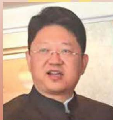
中國駐馬來西亞 特命全權大使 白天